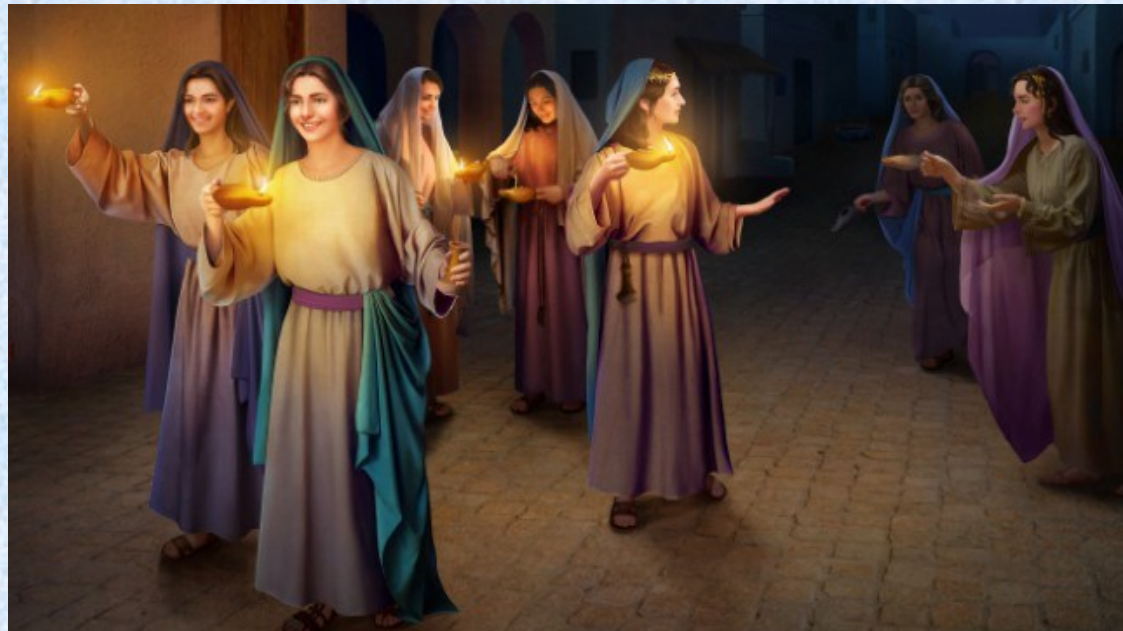
1A. LE VERGINI