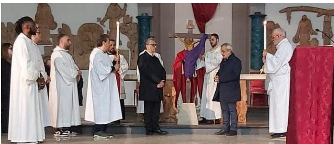
Venerdì Santo: Svelamento della Croce

Il Venerdì Santo indirizza il nostro sguardo verso il Cristo Morto. La contemplazione della Croce fa maturare nel cuore del cristiano quanto espresso dall'orazione iniziale della celebrazione di questo giorno. Il Sabato Santo , la Chiesa in silenzio sosta presso il sepolcro del Signore meditando la sua passione e morte , astenendosi dal celebrare il sacrificio della Santa Messa (la mensa resta senza tovaglia e ornamenti) fino alla solenne Veglia.