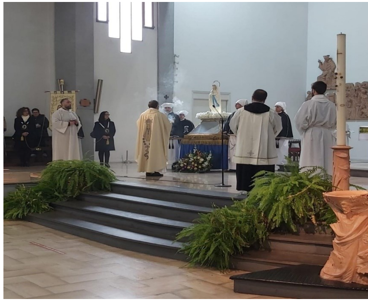
La comunità parrocchiale recita la Supplica alla Beata Vergine Maria di Lourdes