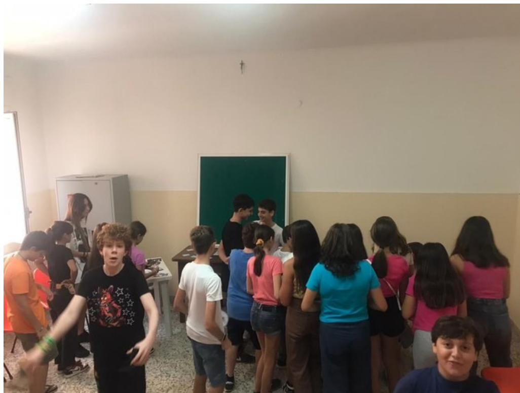
Incontro di catechesi per i ragazzi dell'Iniziazione Cristiana