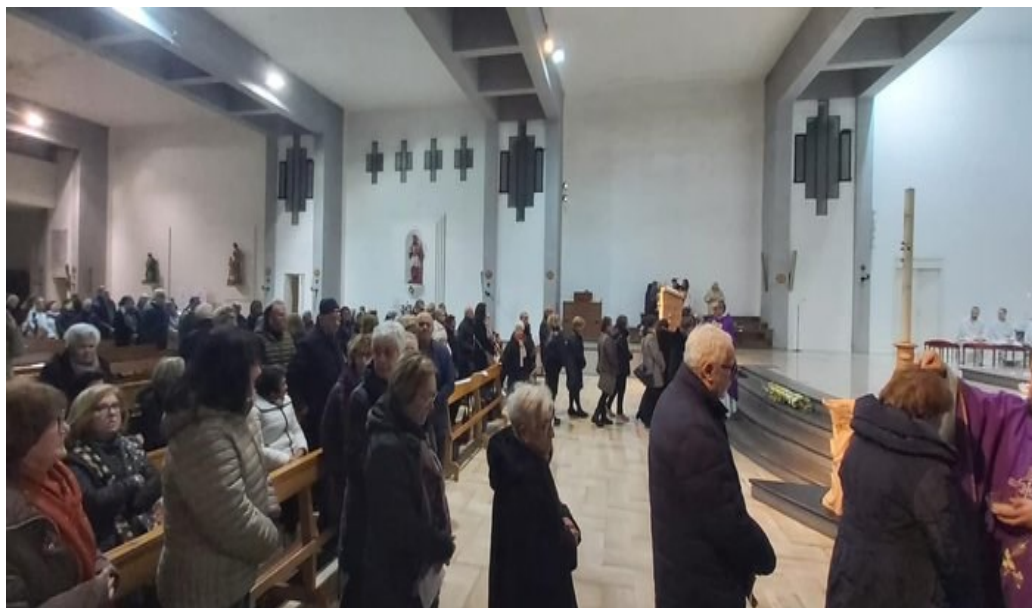
Mercoledì delle Ceneri: benedizione e imposizione delle Ceneri