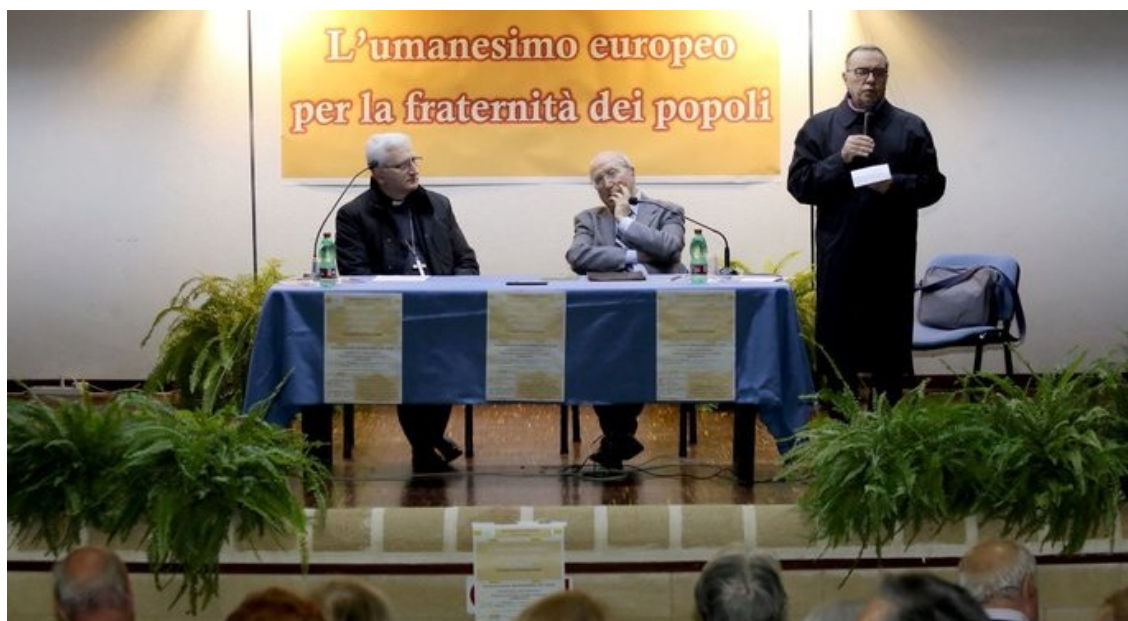
Primo incontro del corso di formazione