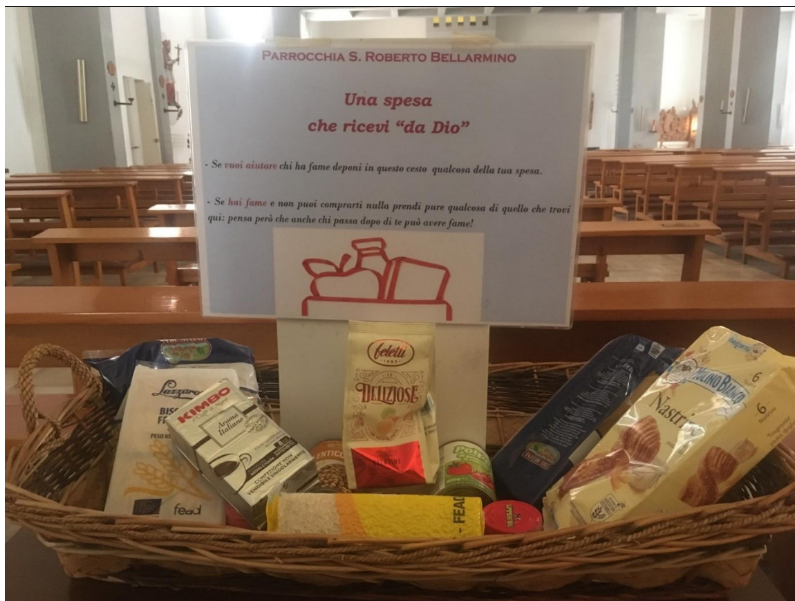
Cesto delle offerte per i più bisognosi