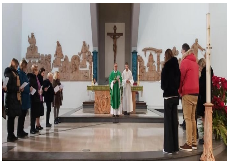
Benedizione dei catechisti (in alto a sinistra), dei ministranti (in alto a destra), degli aderenti di AC (in basso a sinistra) e dei lettori (in basso a destra)