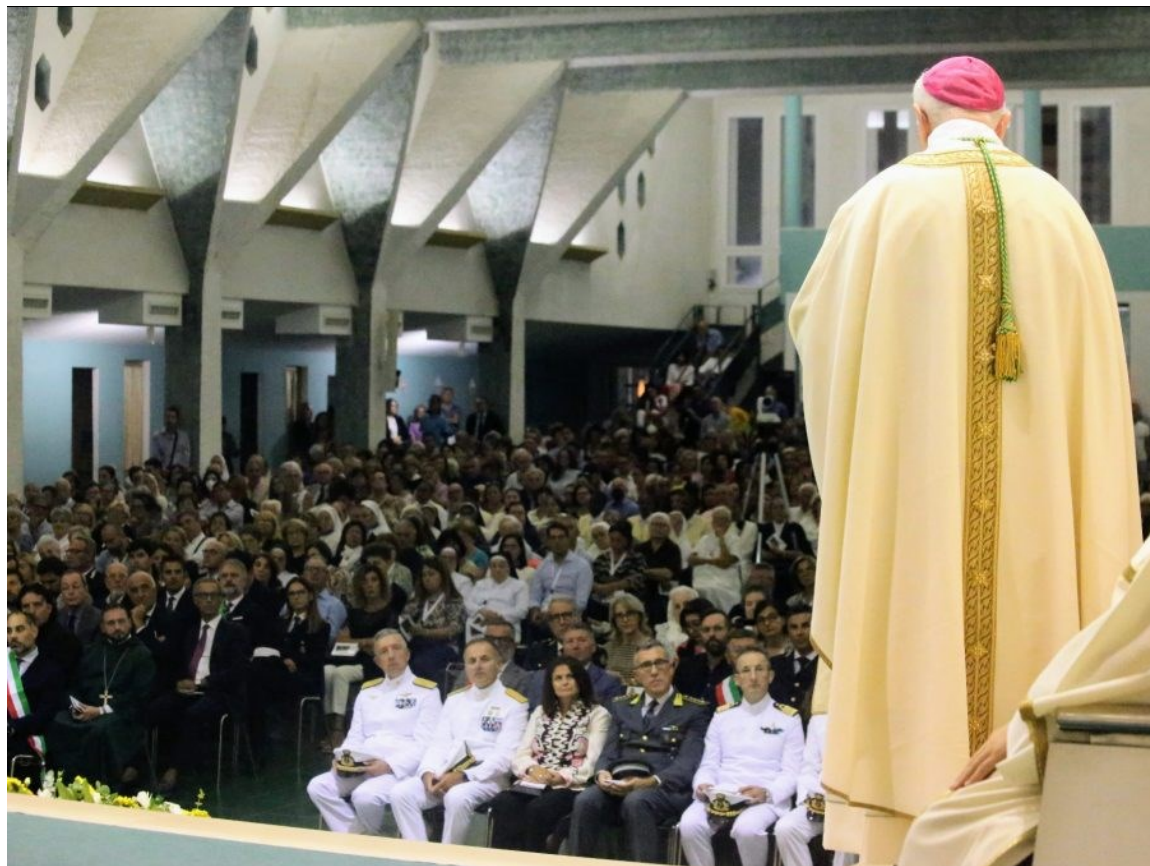
La diocesi accoglie S. E. Mons. Ciro Miniero