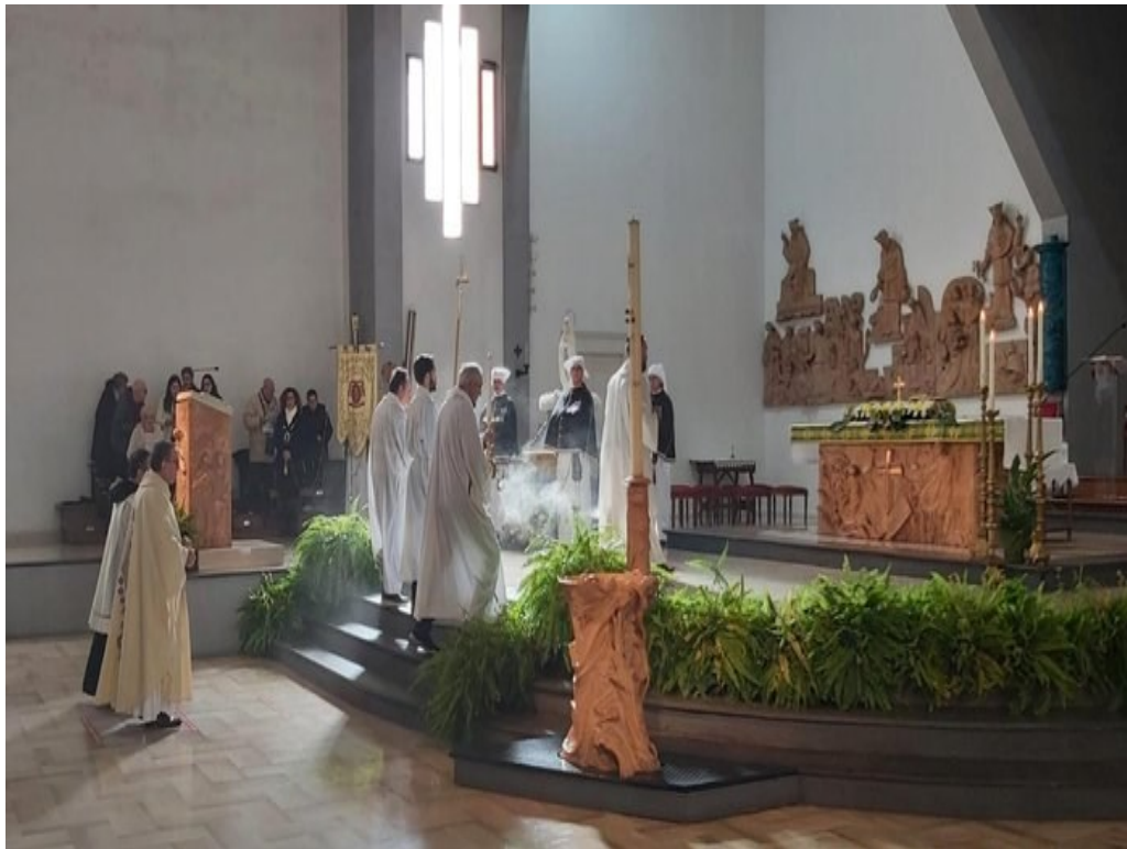
Memoria Liturgica della Beata Vergine Maria di Lourdes