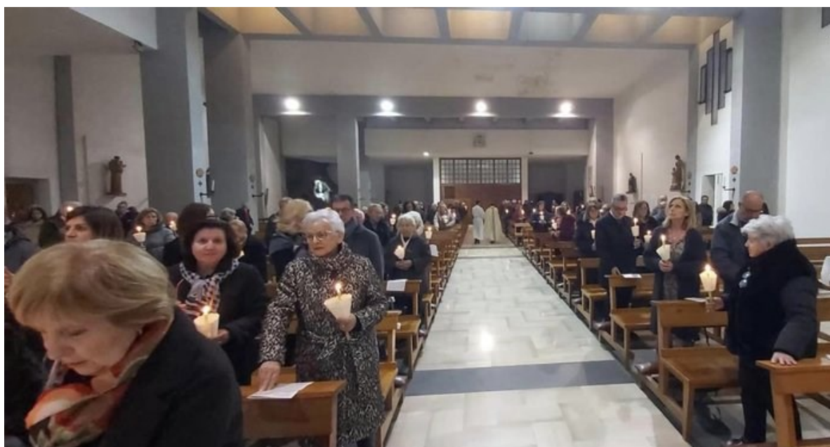
Sabato Santo: Rinnovazione delle promesse battesimali