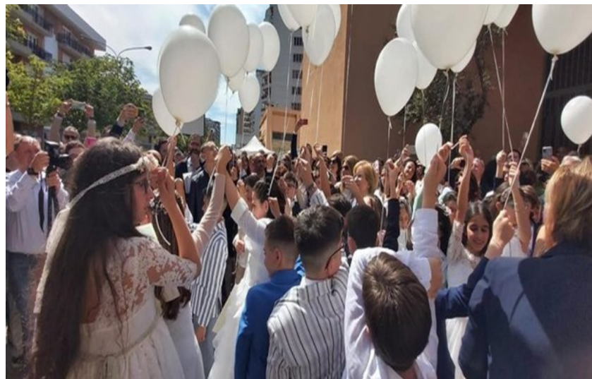
Sacramento della Confermazione, dell'Eucarestia e della Riconciliazione e lancio di palloncini