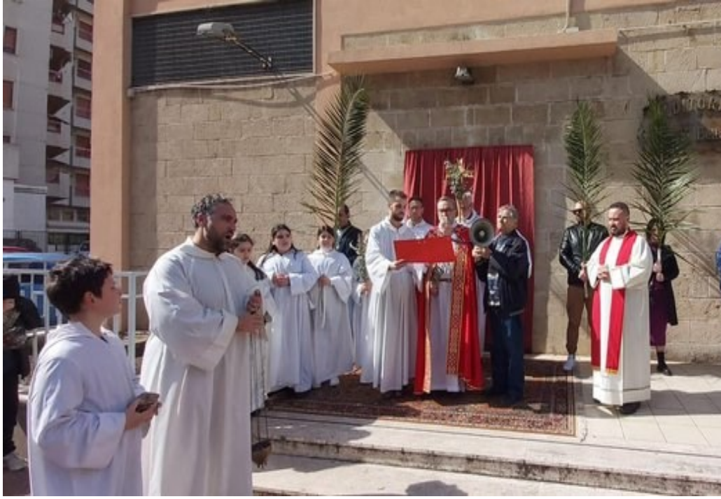
Domenica delle Palme: benedizione dei rami d'ulivo