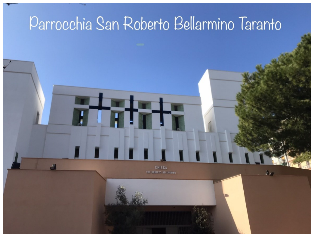
Facciata della Chiesa al termine dei lavori