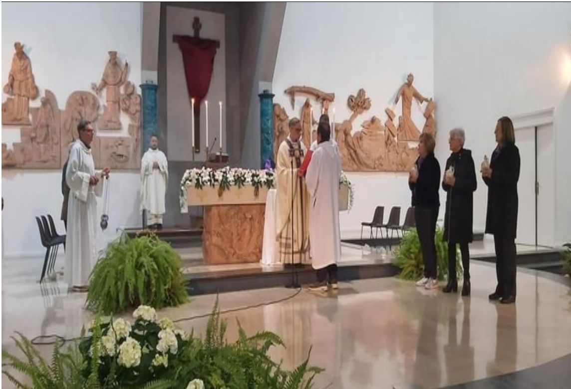
Giovedì Santo: Accoglienza degli Oli Santi