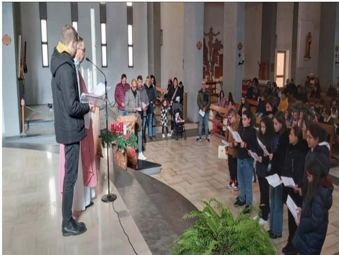
Consegne di Avvento per i ragazzi dell'Iniziazione Cristiana