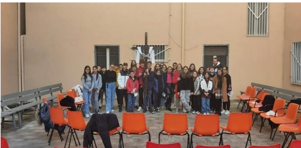
Via Crucis con i ragazzi

Quest'anno anche i ragazzi dell'Iniziazione Cristiana hanno celebrato la Via Crucis , all'aperto o vicino ai bassorilievi presenti in Chiesa. Anche loro hanno capito di non voler essere solo spettatori, ma di voler stare vicino a Gesù, con attenzione, partecipazione, coraggio e forza di volontà .