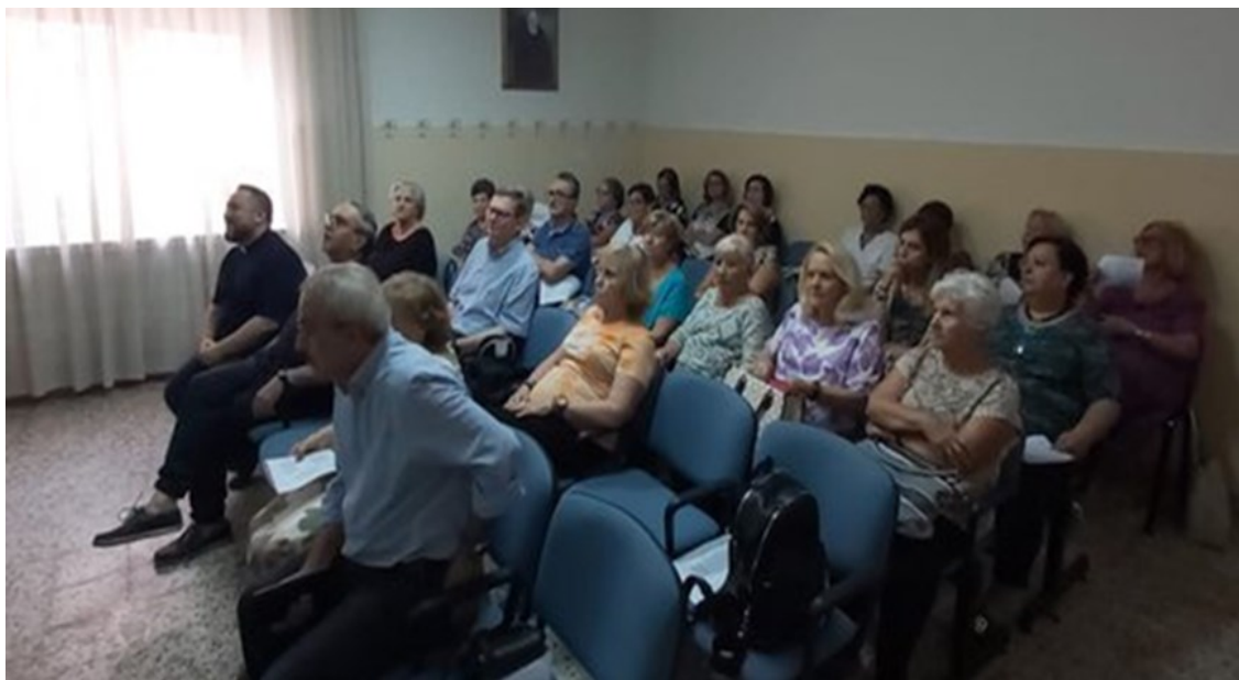
Incontro formativo per gli adulti della parrocchia