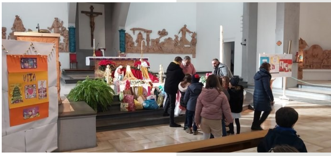
Raccolta di viveri per l'Avvento di Fraternità