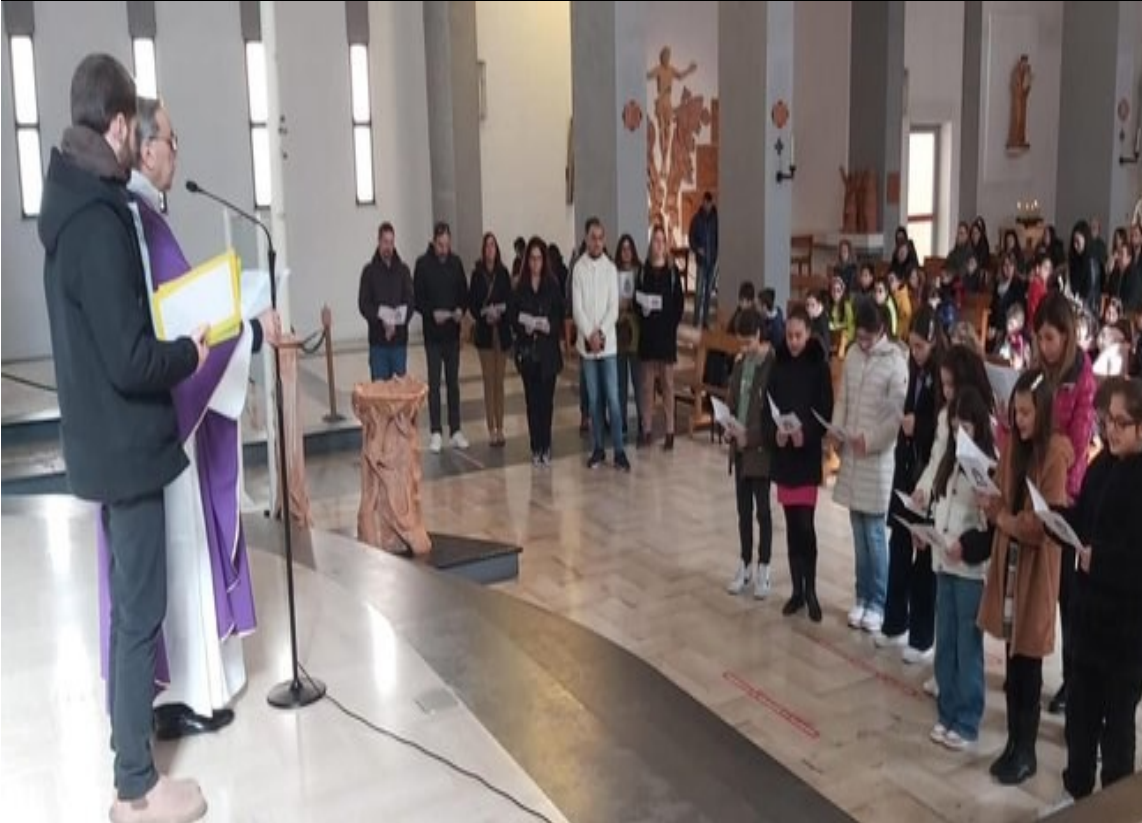
Consegne di Quaresima per i ragazzi dell'Iniziazione Cristiana